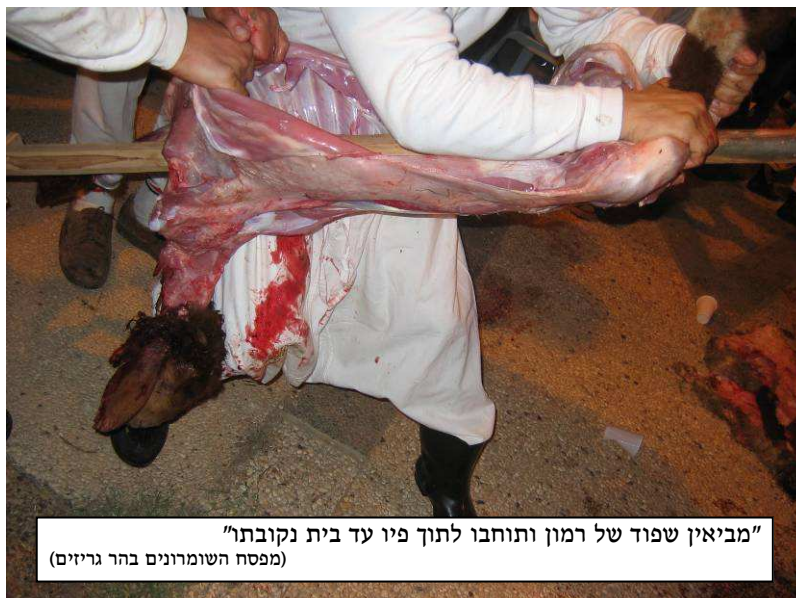
"מביאין שפוד של רמון ותוחבו לתוך פיו עד בית נקובתו" (מפסח השומרונים בהר גריזים)

מנהגו של אמימר: לא היה משרה פעמיים בשר צלוי באותו חומץ